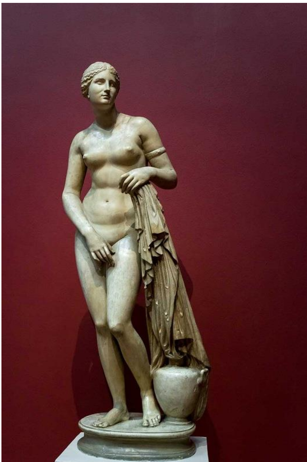
Пракситель. Афродита Книдская. Копия римского времени с оригинала ок. 350 г. до н.э.