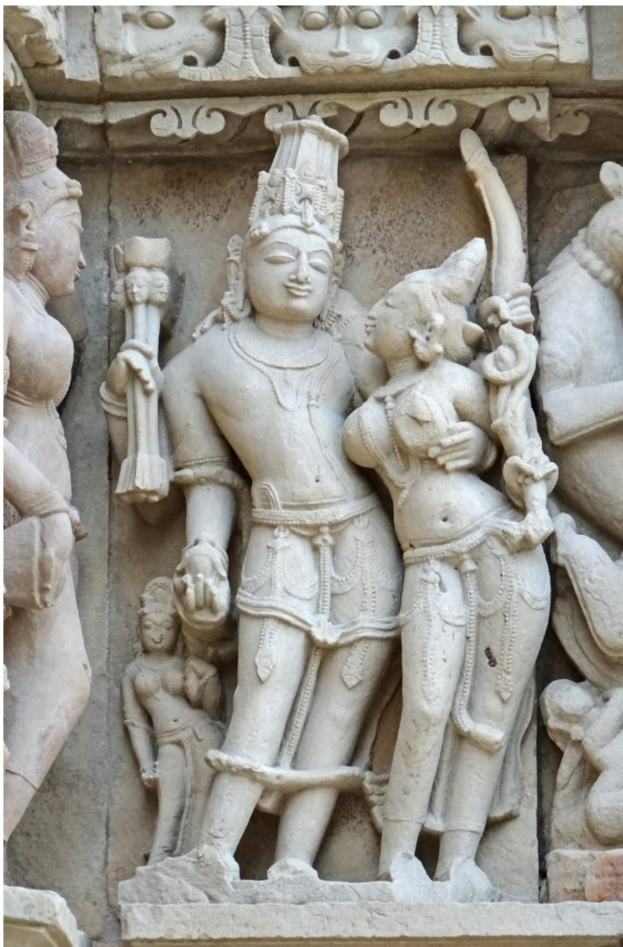
Кама и Рати. Статуи украшают стену храма. Кон. 10 в.

Перед вами два изображения двух богинь любви: индийская богиня Рати, стоящая рядом со своим супругом, и греческая богиня Афродита. Порассуждайте о том, в чем сходство и различие в передаче образа женской красоты в двух этих культурах.